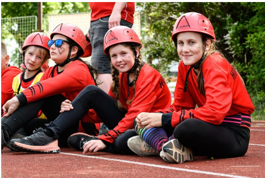
Družstvo SDH Horní Bělá na krajském kole v Plzni