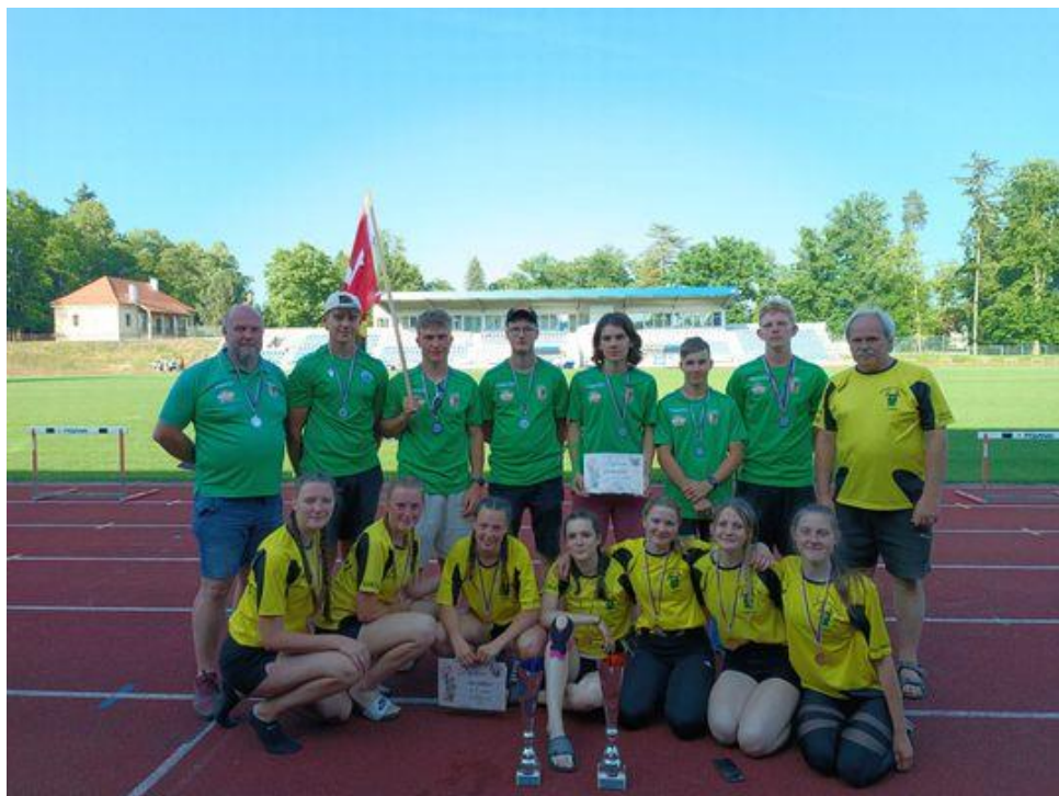
Družstva dorostu SDH Manětín a dorostenky SDH Úněšov při krajském kole v Domažlicích