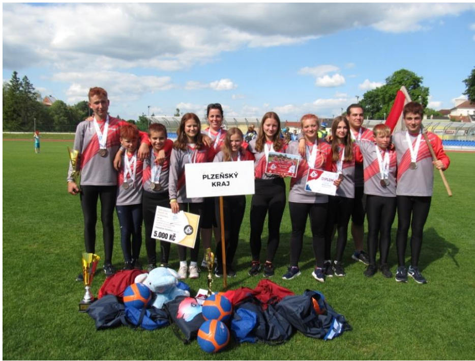
Družstvo SDH Horní Hradiště na MČR Nový Jičín