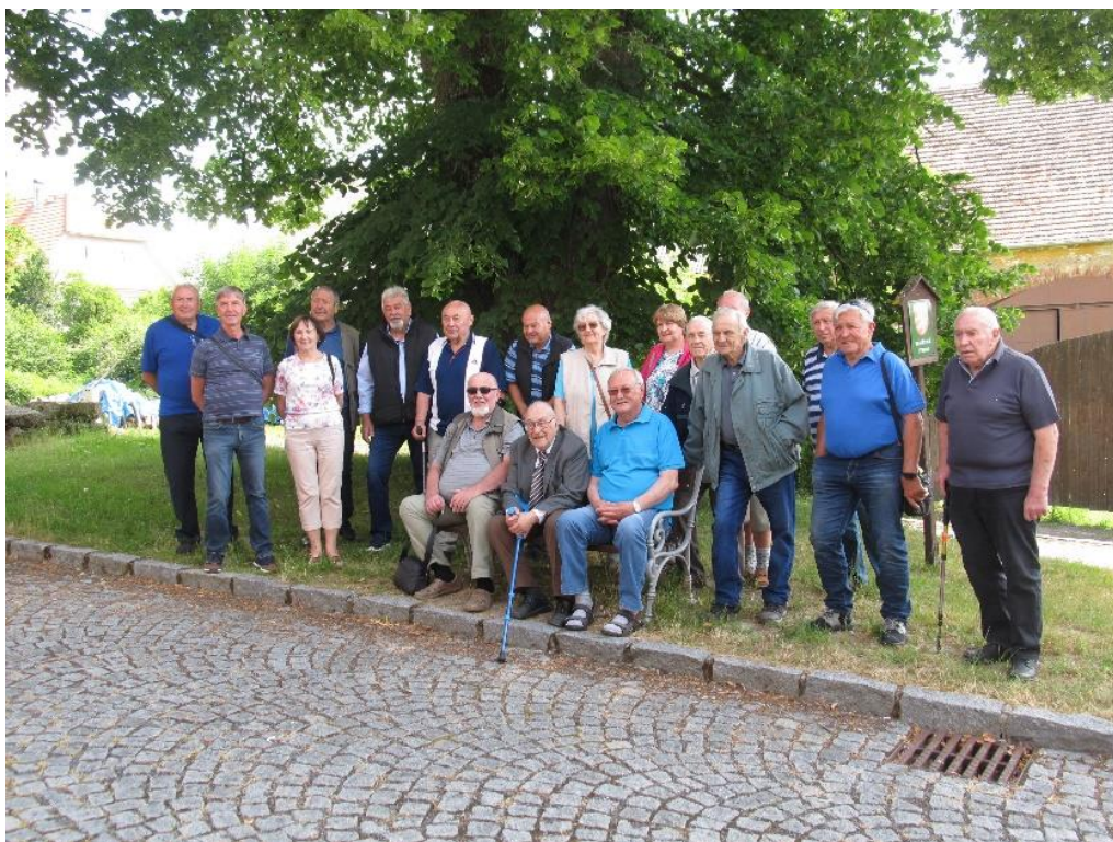
Výlet do Chudenic, prohlídka historických strojů a krásného zámku