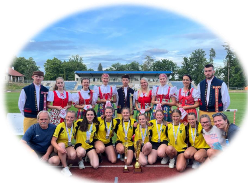
Dorostenky SDH Úněšov MČR v Domažlicích

Další z aktivit OR mládeže je vzdělávání rozhodčích a vedoucích mládeže a dorostu. Školení vedoucích proběhlo 3. - 5. března v kulturním domě v Druztové. Vyškoleni se přijelo celkem 115 vedoucích, kteří měli možnost získat nové kvalifikace, popřípadě si své již dosažené kvalifikace obnovit či navýšit. Celková vzdělanost vedoucích a instruktorů je bezesporu základním kamenem úspěšného vedení dětského kolektivu.