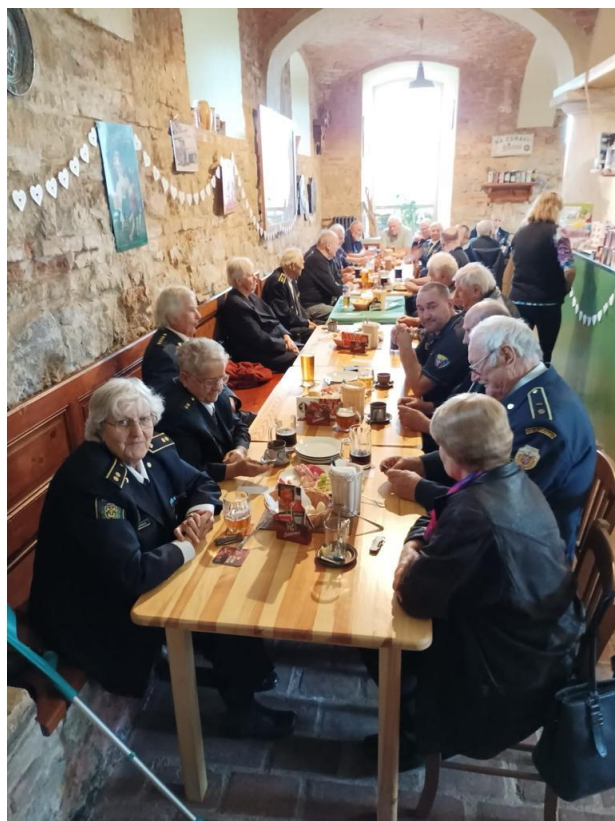
Posezení v zámecké restauraci v Rochlovském záměčku