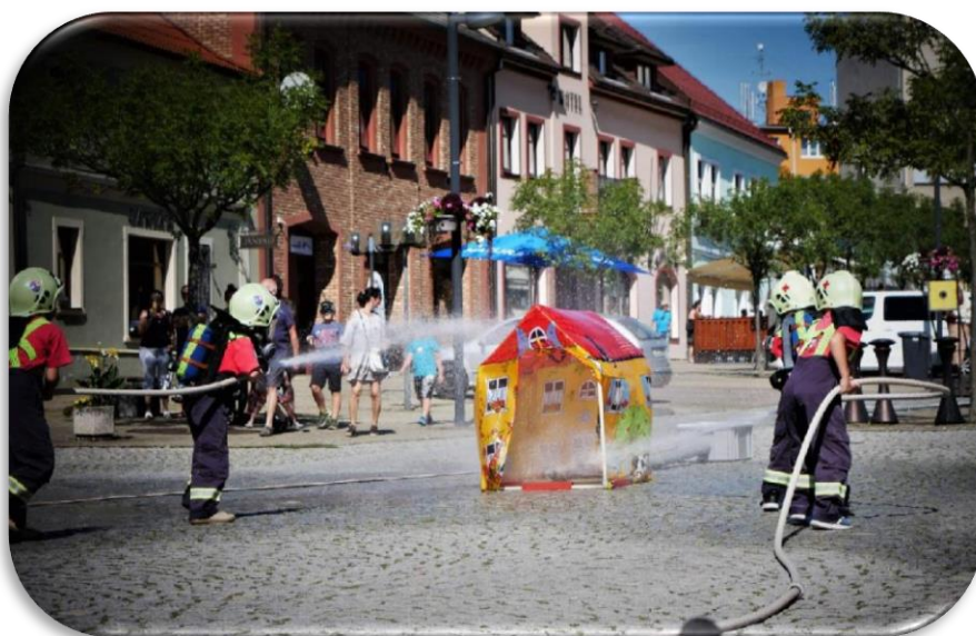
Soptíci SDH Kralovice

Předložené zhodnocení činnosti na úseku mládeže na okrese Plzeň – sever za rok 2023 zdaleka neobsahuje veškeré činnosti s mládeží probíhající na našem okrese, jsem si vědom velké a záslužné práce s mládeží napříč naším okresem. Je třeba neopomenout i činnost mladých hasičů – tzv. přípravky z SDH Kralovice a mnohých okrsků a našla by se jistě celá řada dalších příkladů. Závěrem bych rád poděkoval všem, kteří se podíleli na přípravě soutěží mladých hasičů a dorostu či organizaci školení jejich vedoucích. Poděkování patří také všem reprezentantům našeho okresu, ať na krajských či republikových soutěžích. V neposlední řadě mé poděkování směřuje také ke všem vedoucím mladých hasičů, kteří ve sborech s mládeží pracují. Jejich práce je velmi obětavá a málokdy oceněná dle zásluh. Ve své zprávě nesmím zapomenout poděkovat i Plzeňskému kraji za finanční pomoc, bez které by se soutěže v tak dobré kvalitě nemohly uskutečnit.