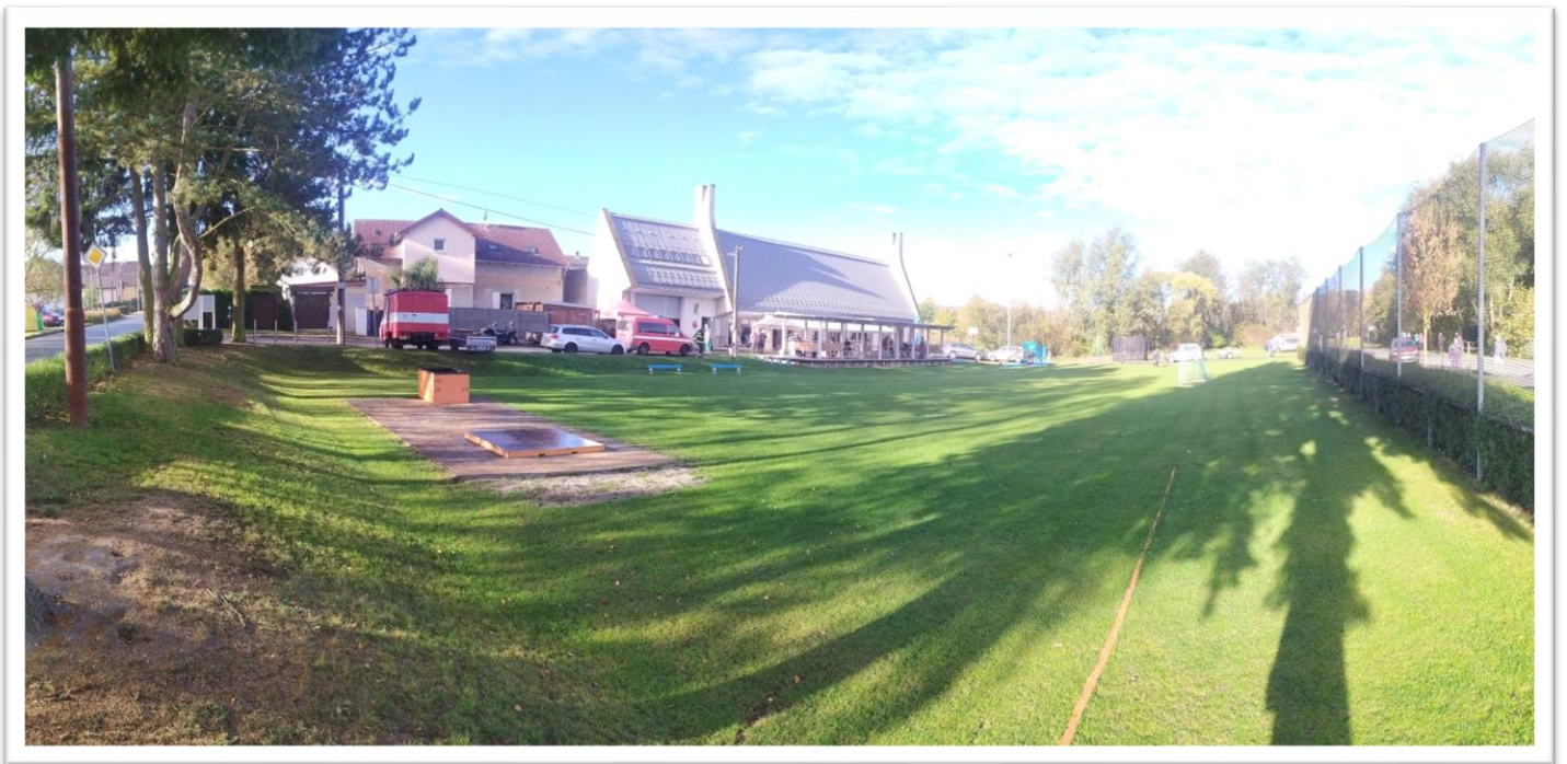
ZHVB Nevřeň krajské kolo