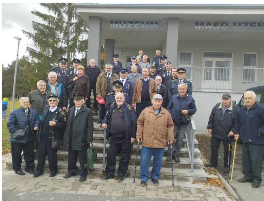
Setkání v Heřmanově Huti