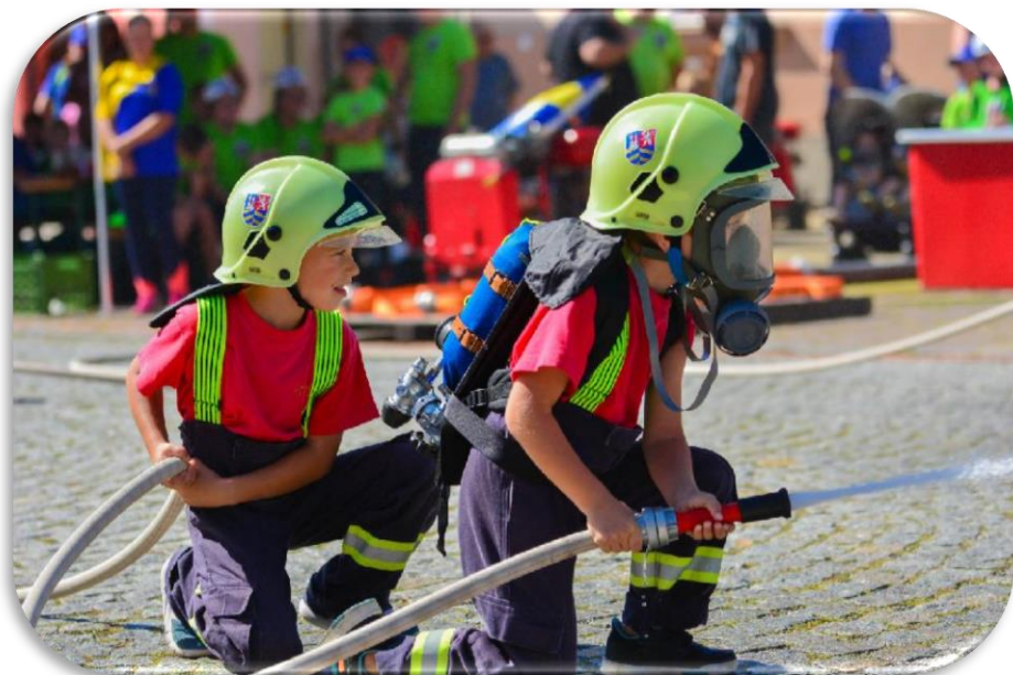
Soptíci SDH Kralovice