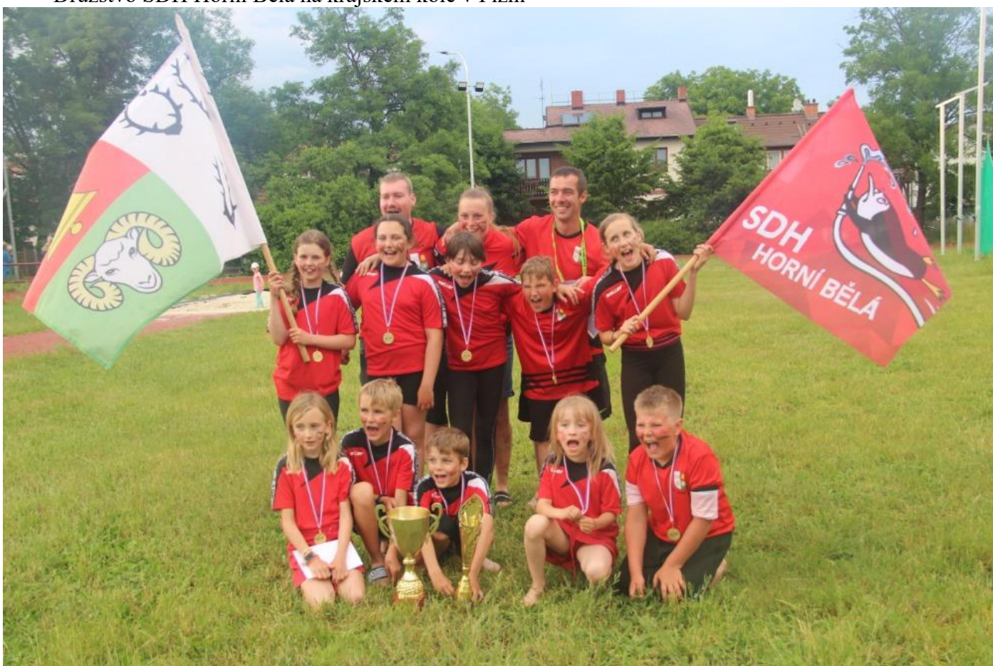
Vítězné družstvo kategorie mladší SDH Horní Bělá – krajské kolo Plzeň