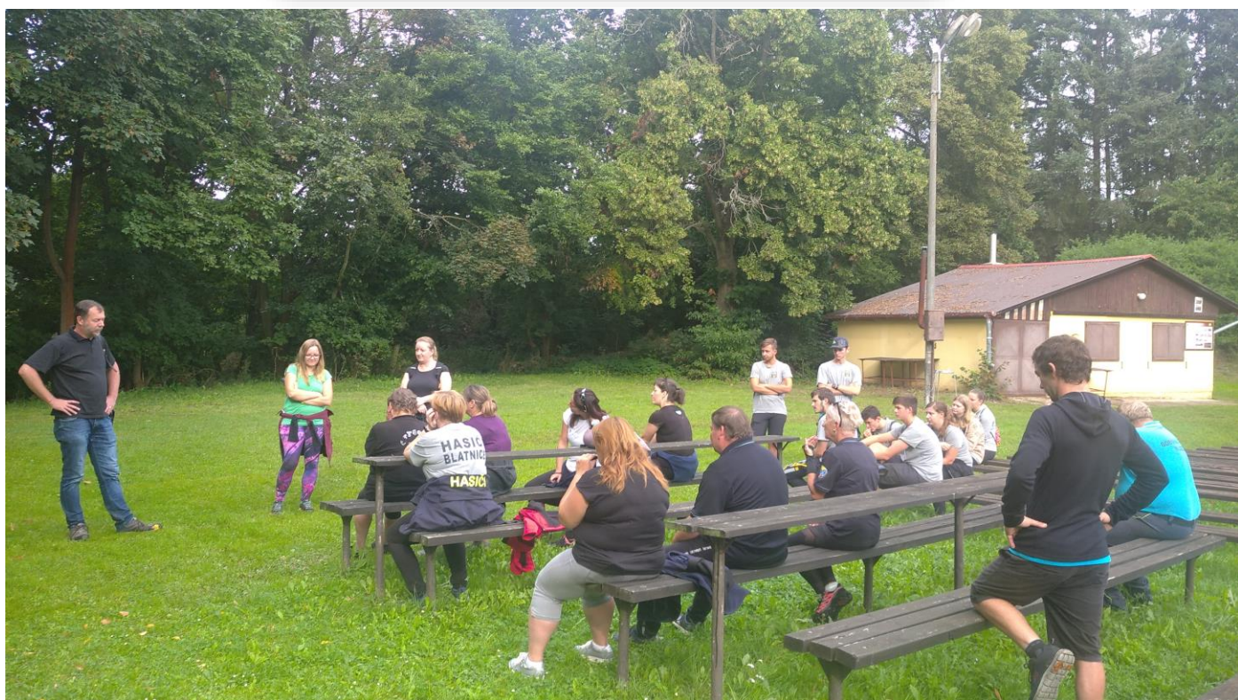
Školení vedoucích mládeže a dorostu na Horní Bělé