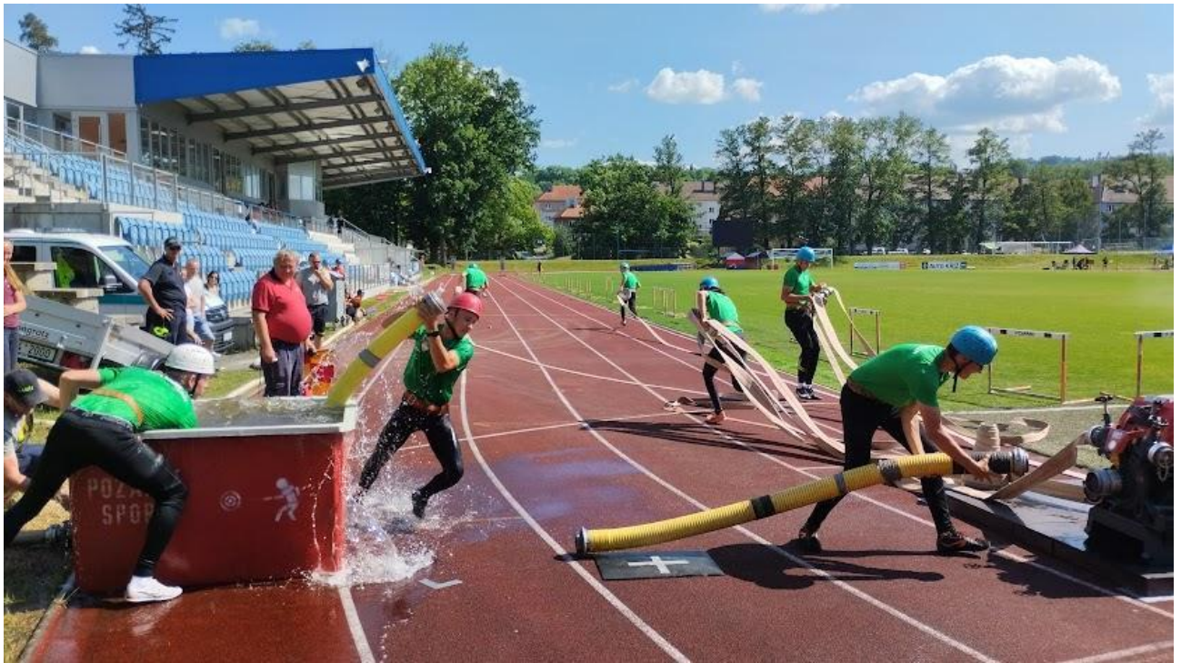
Dorostenci SDH Manětín při požárním útoku na krajském kole