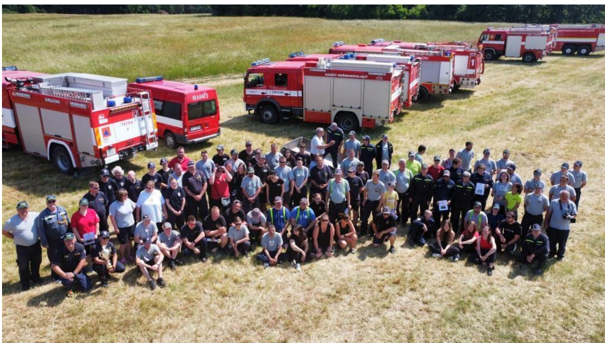
Účastníci výcvikového tábora okrsku Nýřansko

Druhé jednání OORR proběhlo dne 10.3.2023 těsně před zahájením jarního Aktivu velitelů v Tlucné, kde se doladily jeho poslední detaily. Jarní Aktiv velitelů byl zahájen v 18 hodin. Programem tohoto jednání bylo projednání plánovaného cvičení družstev či skupin ochrany obyvatelstva našeho okresu společně s jednotkami požární ochrany v rámci výcvikového tábora okrsku Nýřansko. Vznik nové Odborné rady hasičských soutěží při našem OSH, informace o přípravě zkoušek odborností Hasič II. a III. stupně a nezbytné podání informací o probíhající a plánované odborné přípravě členů JPO ze strany HZS PLK a mnoho dalších užitečných informací.